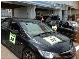
パドックで待機中

そんな時に、草レース(レース形式の走行会)に出場してみたところ、一般の人の車と、私たちがやっている競技用の車では、性能が違うということもあり、軽く優勝できました、そのことがきっかけとなり、草レースをするようになりました。