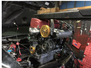
エンジン降ろしは自分でやっています