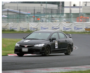
筑波サーキットで走行中