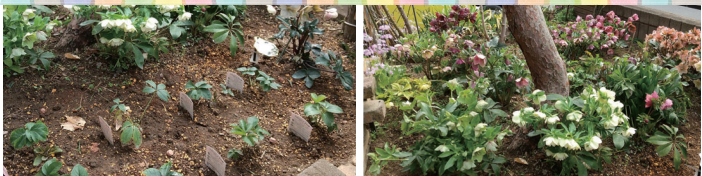
ブラックダブル 氷のパラ・ピコティー

最近、挑戦中の苗は「ブラックダブル」と「ヘルツェゴヴィナス」です。両方とも2年かけて育てるものとなっており、ブラックダブルは1株1,500円ほどで最近流行ってきており挑戦を始めました。