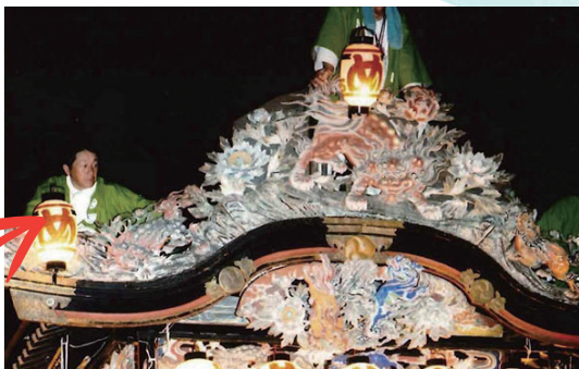
山車に乗っている江田部長