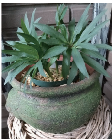
ヘルツェゴヴィナス

ヘルツェゴヴィナスは、1株5,000円ほどすると希少種で種が存在しないため苗での購入となるが、日本での購入はとても難しいとされている。私はこのヘルツェゴヴィナスを1株購入しており、鉢植えに入れてとても大切に育てています。