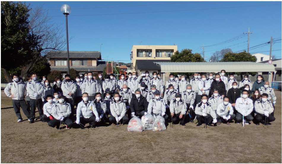
12月27日に第85回社会感謝デーを実施しました。 風がとても強い日でしたが、2022年最後の社会感謝デーでした。 地域の皆様に、日頃の感謝として一年の感謝の気持ちとして本社、支店、各現場で行いました。 来年も日頃の感謝を込めて実施します！