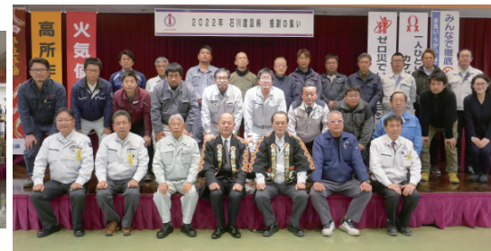
※写真撮影のため、マスクを外しました。